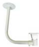
ASTAH300CM Support Plafond