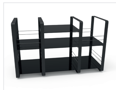
1 module principal / 2 modules complémentaires Finition noire