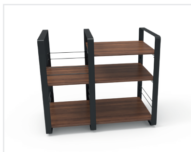
1 module principal / 1 module complémentaire Finition noyer

● Noir/Noir SKU : NORLOFCENBK EAN : 3700795180303